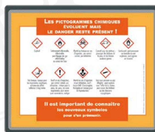
Le tapis de souris Format 237 x 197 mm réf. 0664C

Possibilité d'une adaptation ou création sur-mesure.