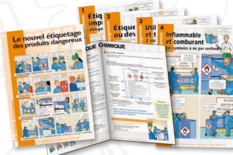
Le pack flash sécurité

Des outils faciles à mettre en œuvre pour animer la sécurité sur le terrain !