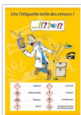
Lire l'étiquette réf. 0370A