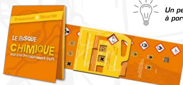
Le risque chimique réf. 0872C Format : 32,6 x 9 cm

Un petit format pour être conservé dans la poche, à porter toujours sur soi.