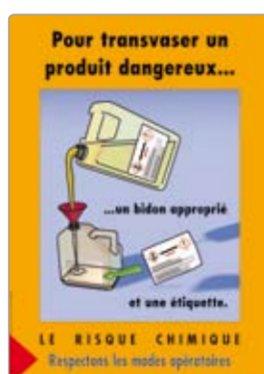
Transvaser un produit dangereux réf. AP31