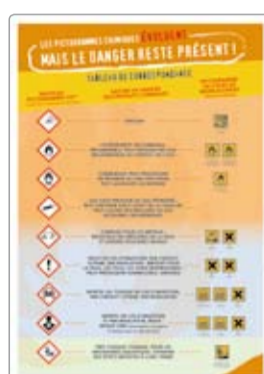
Correspondance chimie réf. 0869A