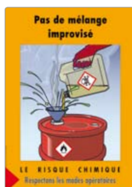
Pas de mélange improvisé réf. AP32