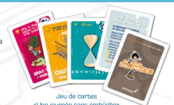
Jeu de cartes «Une journée sans embûche» réf. 1196C

À offrir lors d'un événement sécurité sur site ou pour valoriser les gagnants de jeux sécurité.