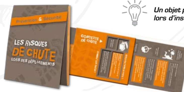
Les risques de chutes réf. 1155C

Des conseils malins pour éviter l'accident de plain-pied, présentés de manière ludique, sous forme de réglotte.