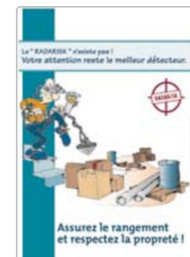
Radarisk réf. 0480A