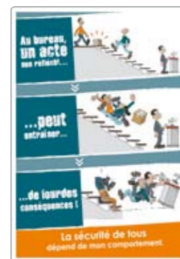
Au bureau, un acte non réfléchi réf. 1078A