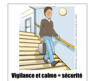
Vigilance et calme = sécurité réf. 1205AUT Format : 10 x 10 cm