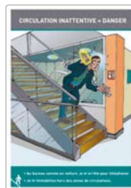
Escaliers téléphone réf. 0909A