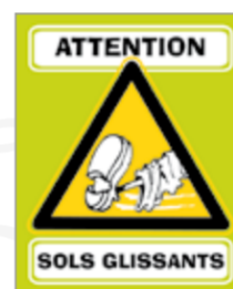
Sols glissants réf. 0409AUT Format : 11 x 9 cm