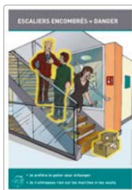
Escaliers encombrés réf. 0908A