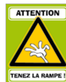
Tenez la rampe réf. 0410AUT Format : 11 x 9 cm