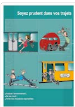
Trajet tranquille réf. 0695A