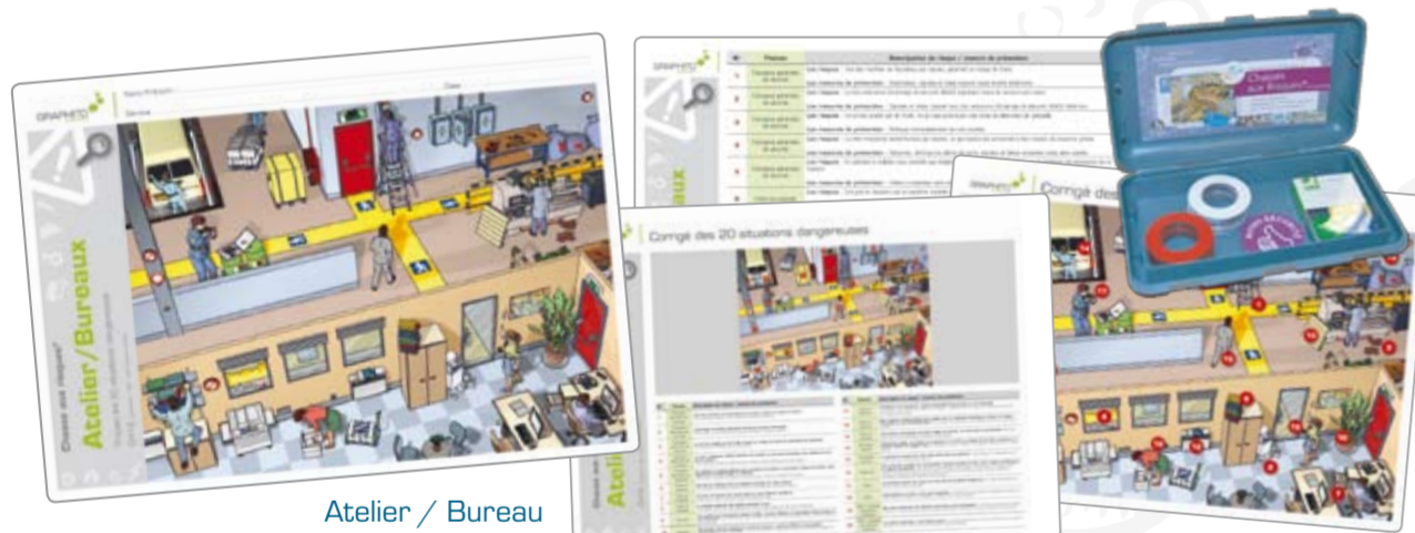
Atelier / Bureau réf. CH19

Un outil simple, dynamique et participatif, animé par les encadrants du terrain.